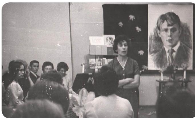
1969 - литературный вечер