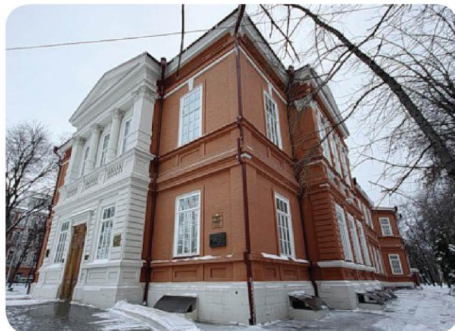
Здание музея в настоящий момент

Культура не приобретается биологическим путем, она создается, ей обучаются на протяжении всей жизни. А культурный человек, это кто? Наверно, лучше всех сказал один из героев А. П. Чехова, доктор Астров из пьесы «Дядя Ваня»: «В человеке должно быть все прекрасно: и лицо, и одежда, и душа, и мысли.» Правда, достичь этого идеала достаточно трудно. Но если ты считаешь себя воспитанным, образованным, порядочным, то есть культурным человеком, то эта заметка для тебя.