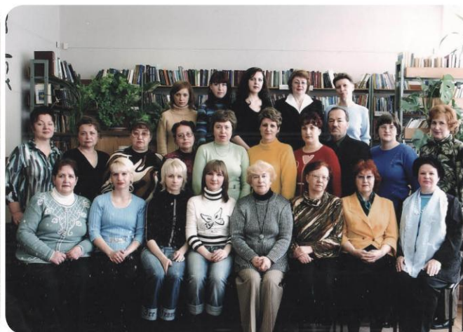
2005 г май – Коллектив библиотеки.