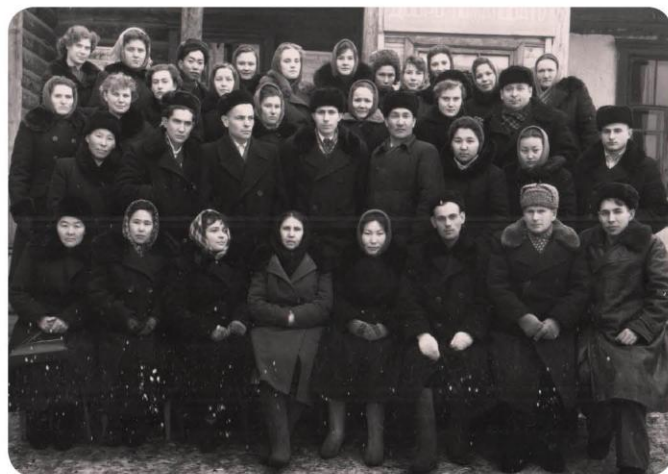
В Бурятии 1960г.