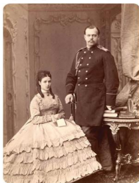
Александр III и Мария Федоровна