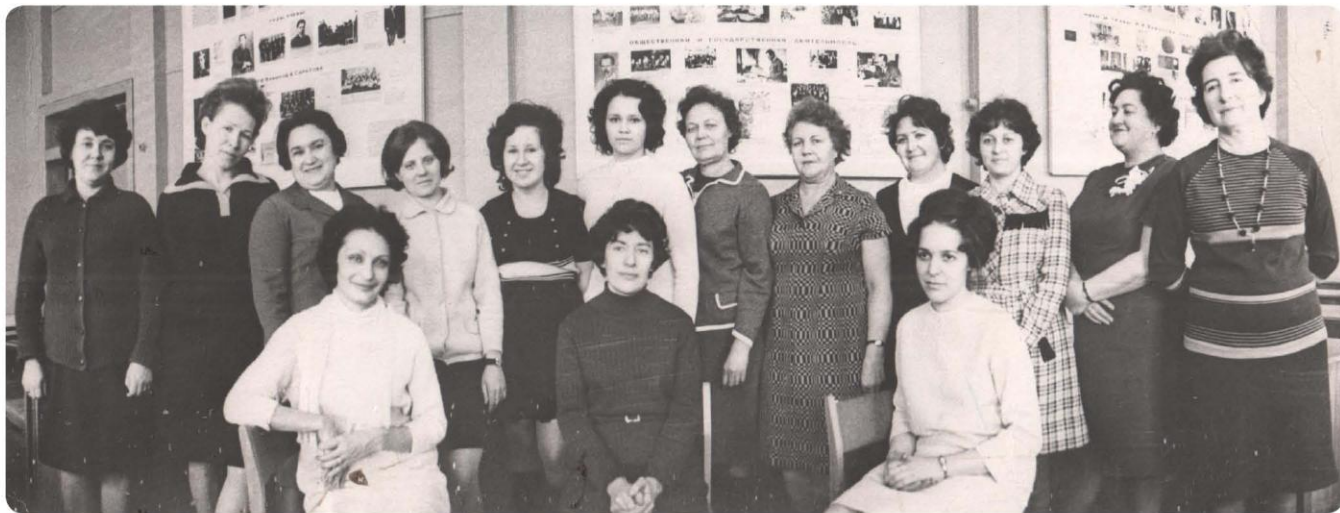
1973 г.-коллектив библиотеки

«Каждый из нас когда-то в первый раз открыл двери библиотеки. Открыл и вошёл в удивительный мир сказок и приключений, повестей и романов, по-трясающих открытий, путешествий, истории стран и человеческих отношений. В этот мир его ввели книги и ещё - чуткие, добрые люди - библиотека-ри. Это была вторая школа, школа без отметок и назиданий, без обязатель-ных предметов, а интересов - по выбору. Кто-то, перечитав множество книг, выбирал для себя мир растений и становился биологом, кто-то погружался в мир формул и математических законов, кто-то «заболевал» геологией. Они уходили во взрослый мир, даже иногда не догадываясь, что первым толчком стала книга, взятая в библиотеке. Но уходили не все, кого-то так заморозил мир книжных полок, тишина читальных залов, трепетное волнение встречи с новым журналом, что они навсегда остались в этом мире - стали новыми библиотекарями. Что же это за профессия, где работают особые люди, о ко-торых редко вспоминают начальники, которым не пишут благодарных писем ушедшие читатели, которые мучительно ищут ответы на чужие вопросы, за-бывая порой о своих собственных? Чем их держит эта малооплачиваемая, трудная морально и физически работа? А наверное это какая-то магия, без которой не будет настоящего библиотекаря». Размышления о профессии. Арапова Н. И.