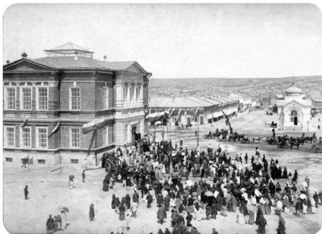
Музей в день открытия

2014 год объявлен указом президента - годом культуры. А что такое – культура? Ведь это понятие, имеет огромное количество значений в различных областях человеческой жизни. Изначально оно означало «возделывание», (то есть было связано с с\х работами), но позднее, в него вошли такие понятия, как воспитание, образование, развитие, почитание.