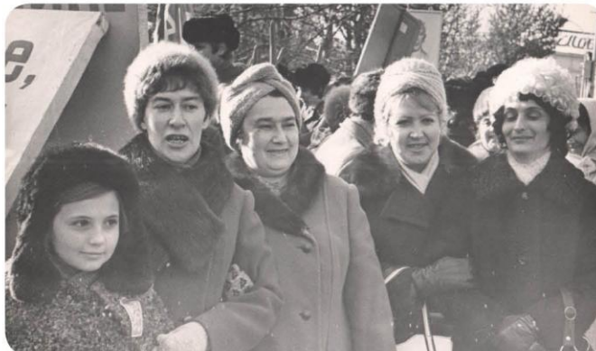
На демонстрации 7 ноября